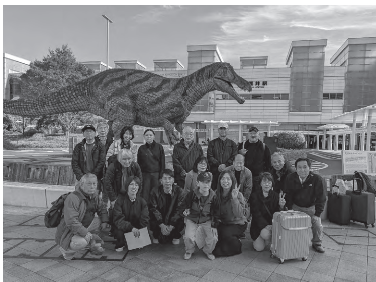
第30回アカデミー同窓会